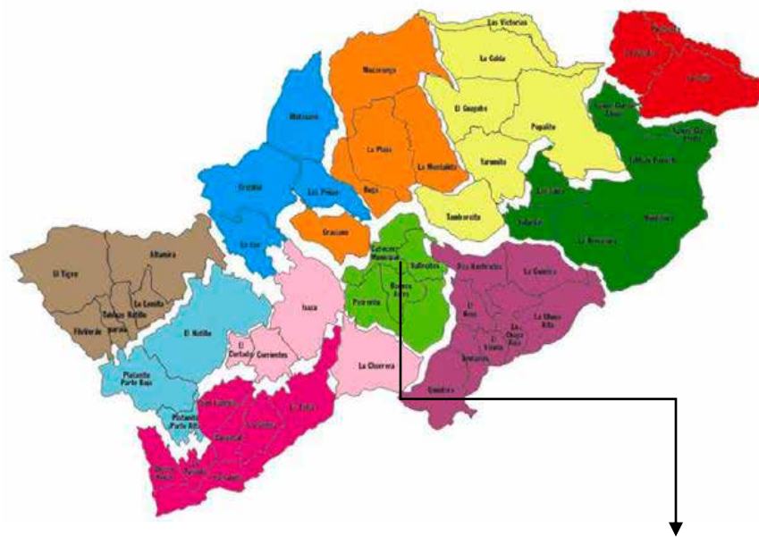
Figura I Mapa de las ALDEAS Barbosa (Ant.)

El municipio cuenta con una división geográfica denominada ALDEAS, Agencias Locales de Desarrollo Autónomo, como se muestra en la Figura 1 definidas a partir de características económicas, culturales, sociales, de movilidad, entre otras. La ALDEA donde se sitúa la zona urbana se llama Diego Fernández Barbosa, se encuentra ubicada en el centro del municipio de Barbosa y cuenta con tres subsectores, distribuidos así: en el centro dos parques, el Hospital, el Palacio Municipal y la zona comercial, posteriormente el sector residencial conformado por los barrios de mayor antigüedad en el municipio y finalmente los barrios de la periferia y las veredas ubicadas en la zona de expansión urbana.