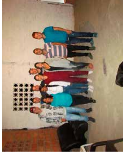
Grupo focal con egresados de la institución